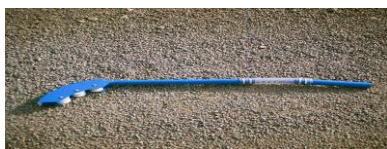
Schachtenboog 300 mm

Horizontale verstelling van de geleidingsarm door de montage van een extra cilinder in de geleidingsarm, is het mogelijk de geleidingsarm één meter naar links en rechts te zwenken. Hierbij is het niet meer nodig exact met de machine voor de drainagebuis te stoppen, men kan corrigeren.